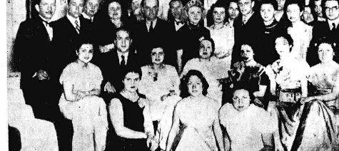
Από την αριστερά...